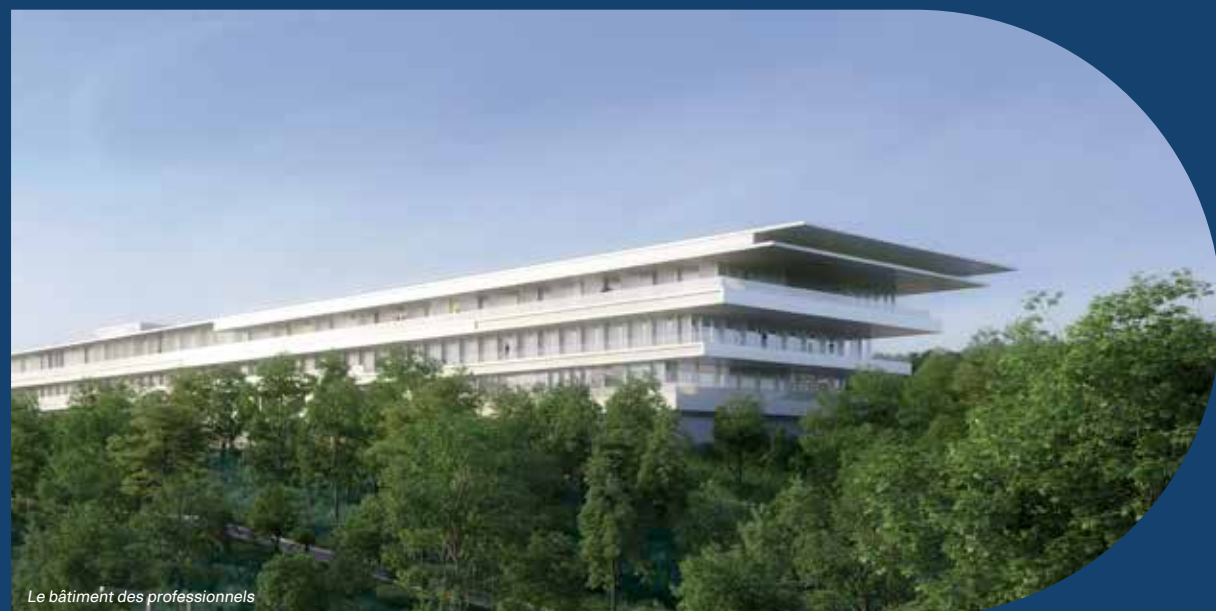
Le bâtiment des professionnels